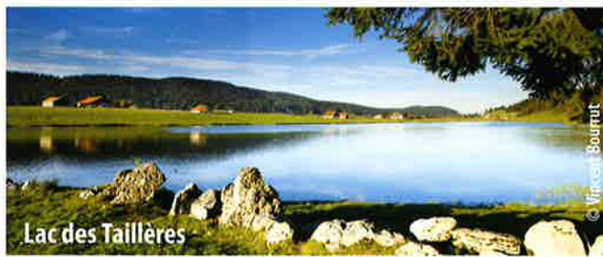
Lac des Taillères

Der Weg folgt den Meilensteinen 13 bis 94